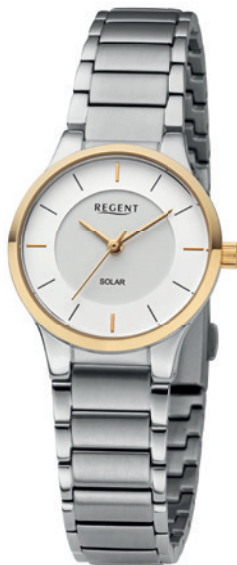
BA-729 Edelstahl IPG, 5 Bar UVP 158,00 €