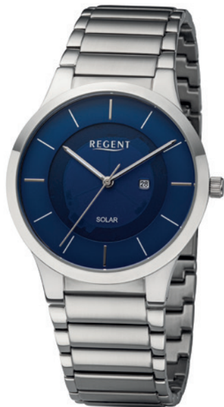
BA-724 Edelstahl, 5 Bar UVP 158,00 €