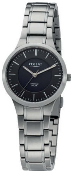
BA-711 Titan, 5 Bar UVP 188,00 €