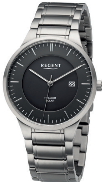
BA-709 Titan, 5 Bar UVP 198,00 €