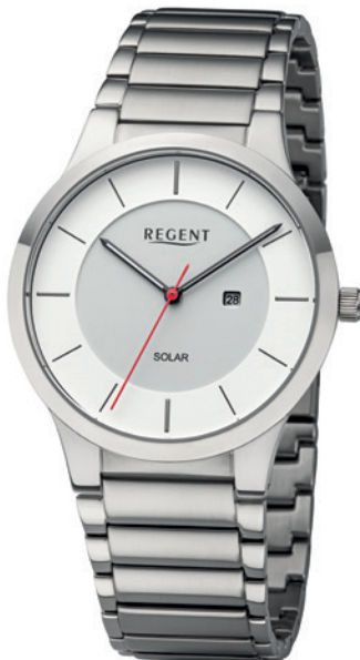
BA-725 Edelstahl, 5 Bar UVP 158,00 €