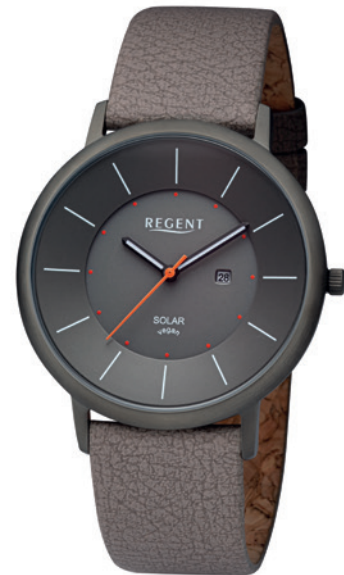
BA-723 Edelstahl IP gun, 3 Bar UVP 158,00 €