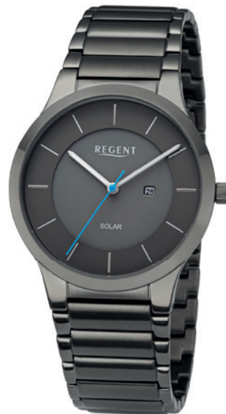
BA-726 Edelstahl IP gun, 5 Bar UVP 168,00 €