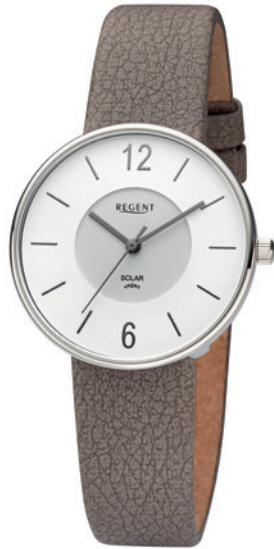
BA-718 Edelstahl, 3 Bar UVP 138,00 €