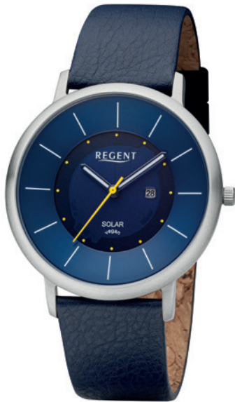
BA-721 Edelstahl, 3 Bar UVP 148,00 €