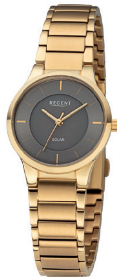
BA-730 Edelstahl IPG, 5 Bar UVP 168,00 €