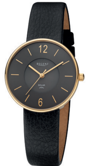
BA-720 Edelstahl IPG, 3 Bar UVP 148,00 €