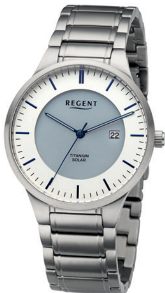
BA-708 Titan, 5 Bar UVP 198,00 €