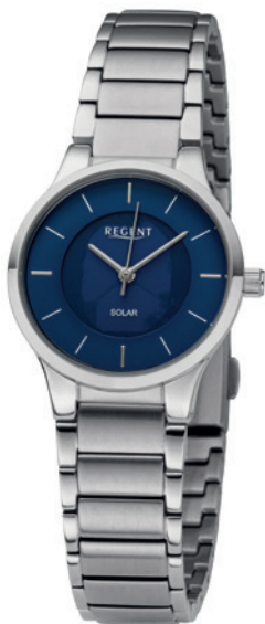
BA-727 Edelstahl, 5 Bar UVP 148,00 €