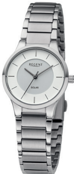
BA-728 Edelstahl, 5 Bar UVP 148,00 €