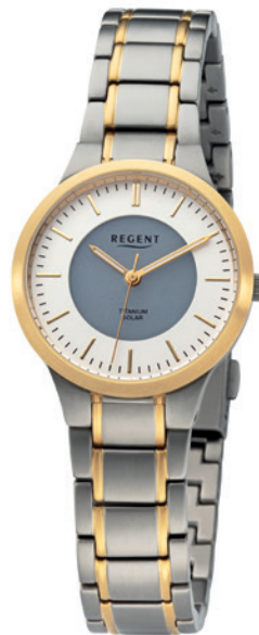
BA-713 Titan IPG, 5 Bar UVP 198,00 €