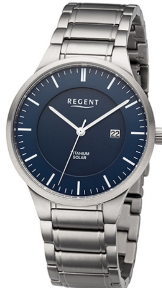
BA-710 Titan, 5 Bar UVP 198,00 €