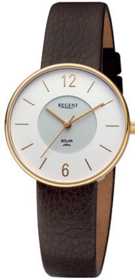
BA-719 Edelstahl IPG, 3 Bar UVP 148,00 €