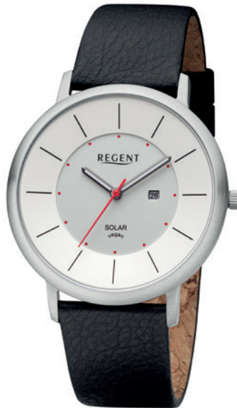
BA-722 Edelstahl, 3 Bar UVP 148,00 €