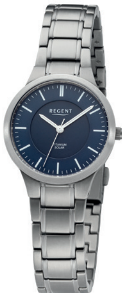
BA-712 Titan, 5 Bar UVP 188,00 €