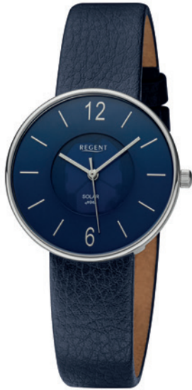
BA-717 Edelstahl, 3 Bar UVP 138,00 €